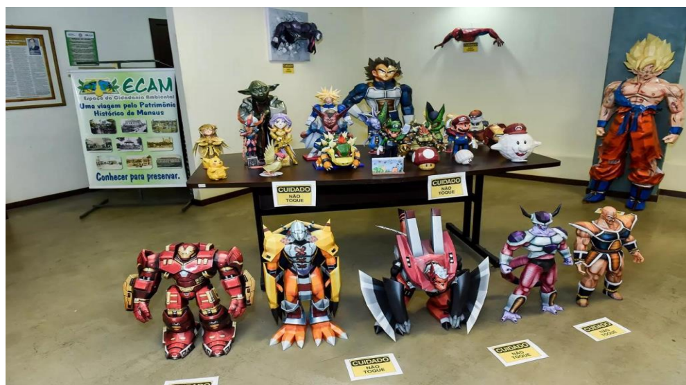
IMAGEM 3 – ESCULTURA EM PAPEL