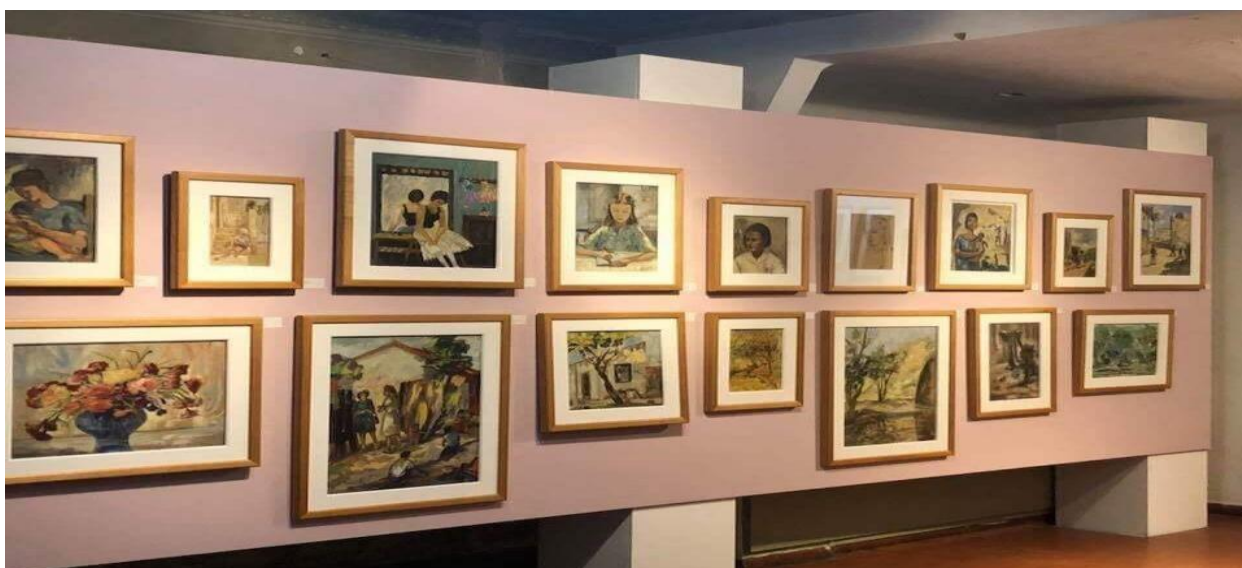
IMAGEM 1 - PINTURAS