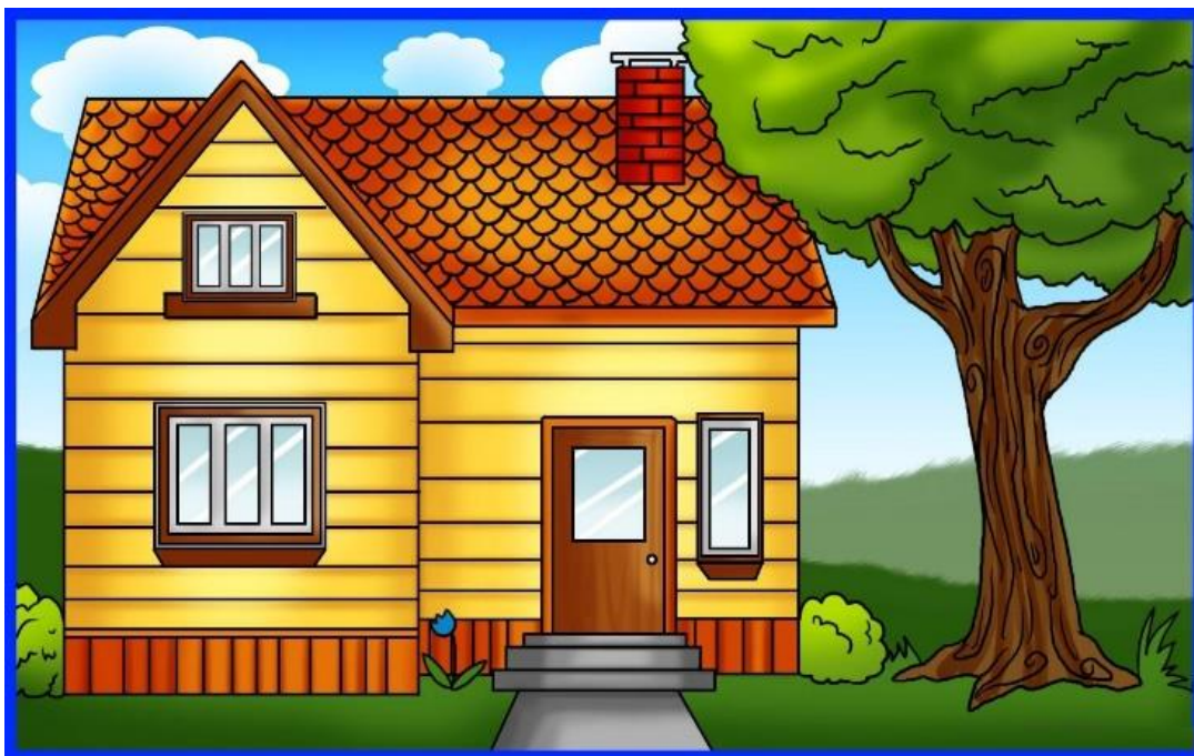
Figura 4: Modelo de uma casa

https://images.app.goo.gl/yZkYX6Nr85Jyeg1U8 . Acesso 10/06/2020.