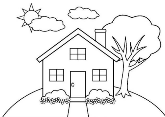
Figura 1: https://images.app.goo.gl/U1M3Uj3SroyTGhhu7 Acesso 10/06/2020.

E neste primeiro momento você poderá observar como é sua sala de estar, seu quarto, uma varanda, sua garagem ou jardim; reflita, existe possibilidade de aprender a dançar breaking nesses espaços? E como?