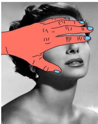
Figura 2. Fotomontagem