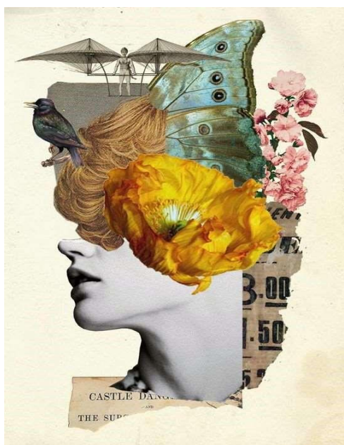
Figura 1: Colagem

Também conhecida pelo termo francês Collage, a colagem consiste em uma mistura de elementos que normalmente fazem sentido individualmente, como recortes de revistas e textos, desenhos, objetos, tecidos, entre outros. Estes materiais são incorporados a uma composição, sofrendo uma espécie de efeito “unificador”, de forma que ganham um novo sentido como conjunto. A colagem tem um fim, que é criar uma imagem ou forma através da sobreposição de todos estes materiais.